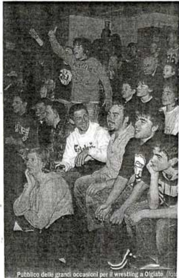
Pubblico delle grandi occasioni per il wrestling a Olgiate. Foto