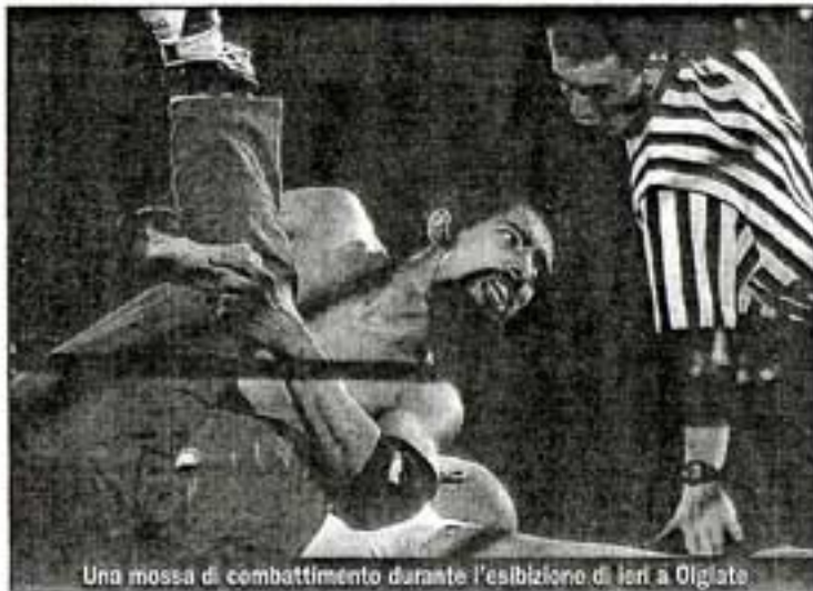
Una mossa di combattimento durante l'esibizione di ieri a Olgiate.

Da qui l'etichetta di "sports-entertainment" (sport-spettacolo) che poco o nulla ha a che spartire con le origini della disciplina che si fanno risalire agli inizi del ventesimo secolo, quando nelle fiere itineranti venivano organizzati incontri di "catch" che mischiavano insieme diversi stili di lotta ed arti marziali co-